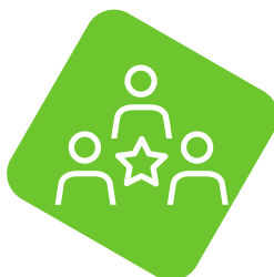
Enge Vernetzung im Team