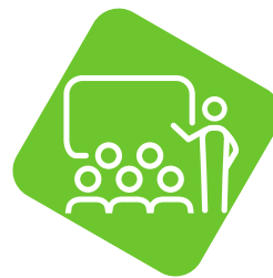
Weiterbildung und -entwicklung