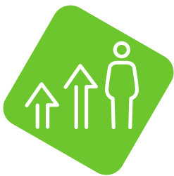
Karriere & Entwicklung