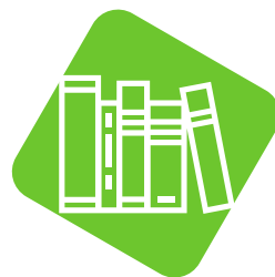
Fachbibliothek / -mediathek